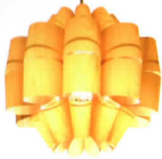
DON-W [谷 俊幸]

素材には透明のP.P.(ポリプロピレン)の表に桜突き板を貼り付けることにより木目を際立たせている。明かりを打すと花の形やいろいろな表情の光と影が作り出される。 材質: ポリプロピレン・桜突き板 光源: 普通ランプシリカ60W (100Wまで対応)