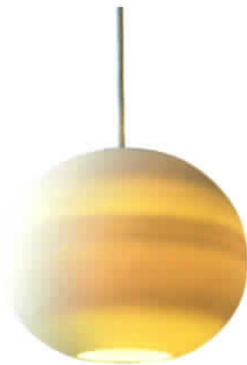
信楽透器 [コイズミ照明]

ランダムに伸びるラインが印象的な和の空間を演出する和紙ペンダント。すらりとしたデザインが魅力。 材質: 楕円(コウゾカス)入り紙 光源: 電球形蛍光灯(電球色)60W