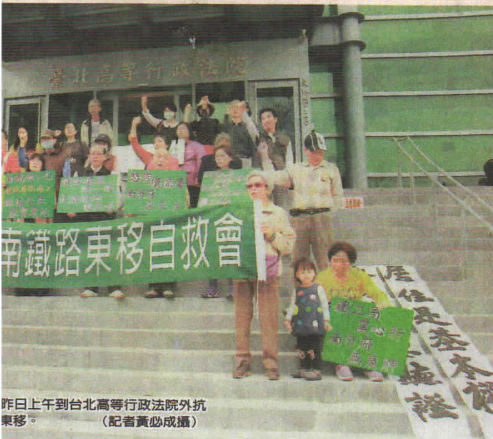
昨日上午到台北高等行政法院外抗議東移。