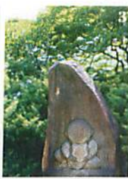
3 宝鏡寺は人形を祭るお寺。4 目の前の宝鏡寺の境内で、天気の良い日は傘の天日干しが見られる。

上京区寺ノ内通堀川東入ル百々町546 ☎075-441-6644 営業10:00~17:00 ※年末年始 http://www.wagasa.com/