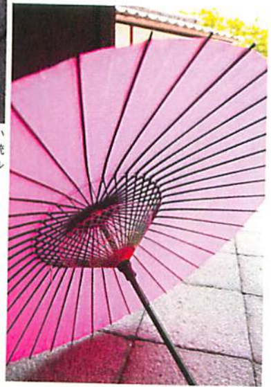
傘に合わせて紙や竹などを使い分け、自然素材で仕上げる伝統の逸品。光を透かした色とシルエットはうっとりする美しさ。