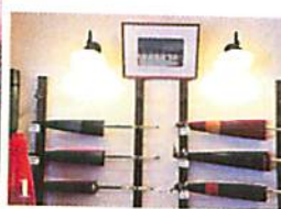
1 江戸後期の創業。店主以下20代30代の若手が支える。2 丁寧な手仕事。予約すれば見学もできる。