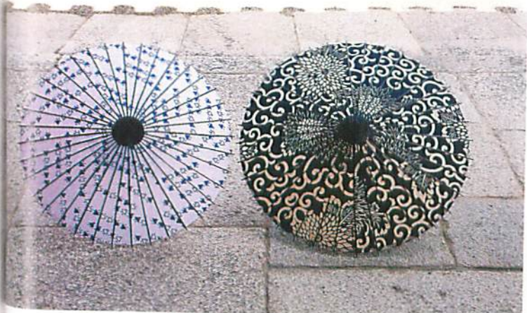
木綿の日傘。限定品の千鳥柄と紺色ベースの唐草模様。夏が楽しくなる。