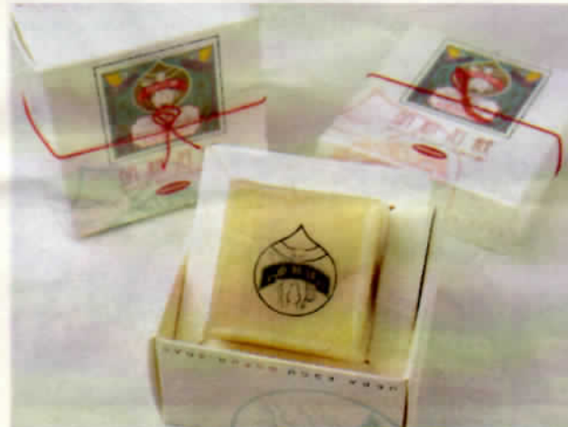
京都しゃばんや×上羽絵惣「胡粉石鹸」1個1,500円(40グラム)/2,800円(90グラム) 一つ作るのに3カ月はかかるというキューブ型のせっけん。「白狐印」がおしゃれ。

U・S・O」とコラボした布地の和日傘。「SO・SO・SO」オリジナルのモダンでポップな絵柄がデザインされた傘は、「SO・SO・SO」ファンならずとも気になる商品。布地は紙よりも伸縮性があり、張り付けの作業も難しいという。開いた時に絵柄が映え、閉じると骨組みが美しく見えるようにと、計算された構造に職人の技が光る。