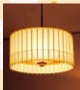
★古都里(広げた状態)

和傘の美しさは、竹を組み上げたときの幾何学模様と和紙を透過する光にあると思います。それを生かせるのは、まず照明かなと。傘のように折り畳める「古都里-KOTORI」は照明デザイナー長根寛氏たちとの、和傘を現代風にアレンジした「WAGASA」(ワガサ)は伝統の革新を目指すSINARUグループとのコラボから生まれました。今後いろいろな分野のクリエイターとの出会いを通じて、和傘の良さを広めていければと思っています。