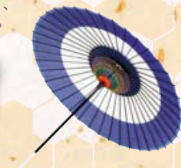
和日傘・網張り(蛇の目/紫白)