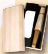
★古都里(畳んだ状態)