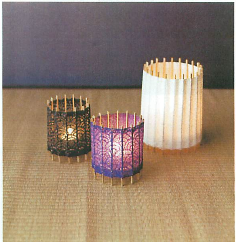
「古部里-KOTORI-」の新作がキャンドルホルダーの(T-Light)。折り畳めばコンパクトに。S・3990円、L・4935円。

●上京区寺之内通堀川東入ル百々町546 営10:00~17:00 無休 www.wagasa.com/ 蛇の目傘2万5200円～、番傘1万8900円～、日傘7350円～。 MAP B-2