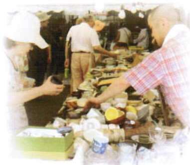
昨年の「清水焼の郷まつり」の様子

京都館では、「清水焼の郷まつり」(毎年10月の第3金土日曜日に開催)を東京でも雰囲気を楽しんでいたと、「ミニ陶器まつり」を開催いたします。掘り出し物を多数集めてお待ちしております。