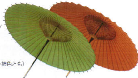
羽二重(緑・柿色とも) 39,900円